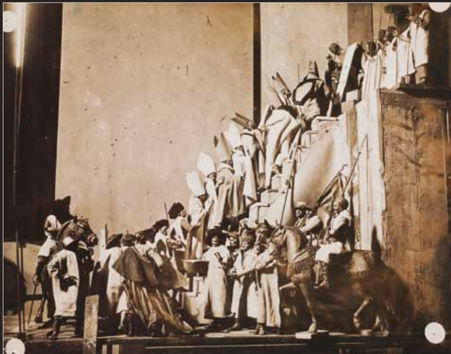
J.M. Sert, Foruen herria, azterlana / Estudio para Pueblo de fieros