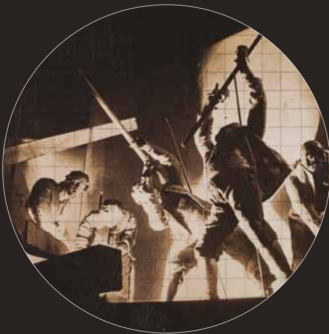
J.M. Sert, Olagizonen herria (zatiá) (azterlana) / Estudio para Pueblo de Ferrones (fragmento)

Plazas limitadas. La inscripción se formaliza una vez realizado el pago.