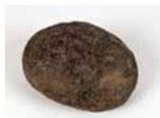
Cocedor de leche: pedra