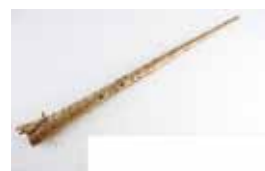
Sunpriñua: corteza de avellano