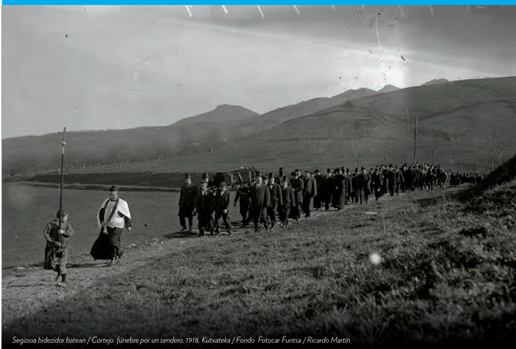
Segizioa bidezidor batean / Cortejo fúnebre por un sendero. 1918.