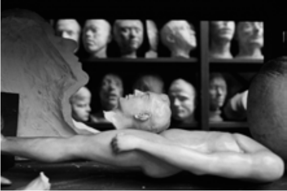
Isabel Azkarate, 2017.

La íntima relación del ser humano con el arte es el hilo conductor que conecta las tres series temáticas que componen esta muestra de Isabel Azkarate, considerada la primera mujer fotoperiodista del País Vasco.