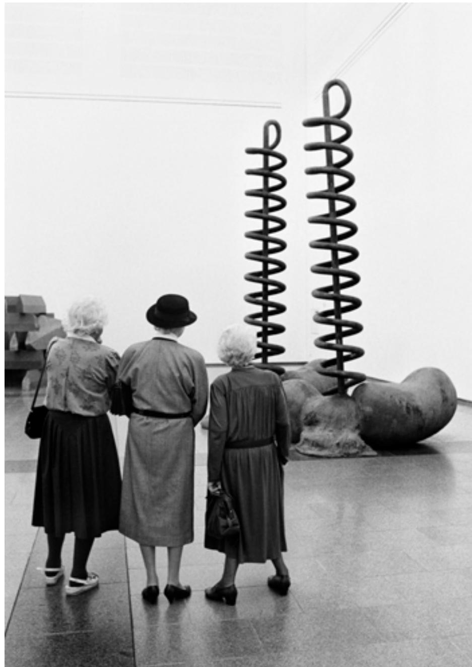
Emakumeak Tony Craggen eskultura bati begira / Mujeres observan una escultura de Tony Cragg, Dusseldorf, 1989