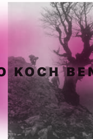
LAINOA / NIEBLA