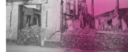
EBROKO GUDUA. BONBARDAKETA / BATALLA DEL EBRO. BOMBARDEO

Jarduera guztietarako beharrezkoa da lekua museoaren webgunean erreserbatzea. Jarduera doakoak dira, baina bisita gidatuetan museoko sarrera eskuratu behar da. / Es necesario reservar plaza para todas las actividades, en la web del museo. Las actividades son gratuitas, pero para las visitas guiadas hay que adquirir la entrada del museo.