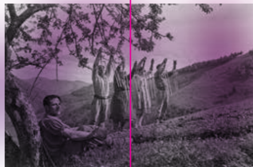
LAIARIAK / LAYADORES