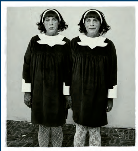
Diane Arbus Biki berdinak / Gemelas idénticas Roselle, New Jersey (1967) . 2014