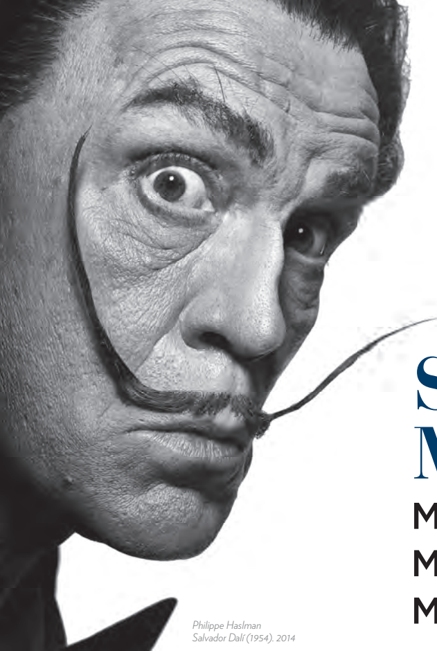
Philippe Hasman Salvador Dalí (1954). 2014