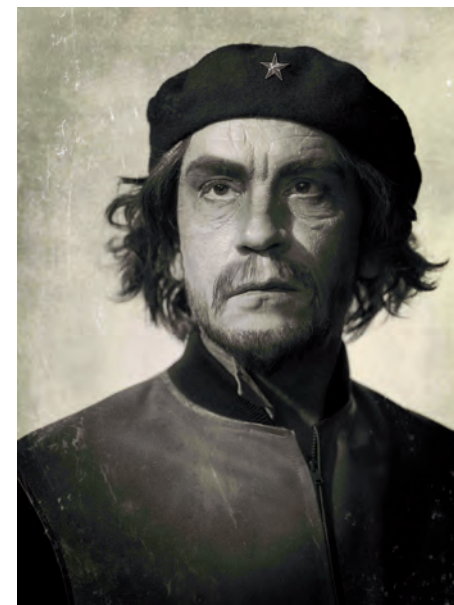
Alberto Korda Che Guevara (1960). 2014

ARGAZKILARITZAKO MAISUEI OMENALDIA HOMENAJE A LOS MAESTROS DE LA FOTOGRAFÍA