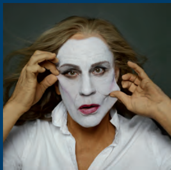
Annie Leibovitz Meryl Streep, New York (1981) . 2014

John Malkovich está considerado como uno de los mejores actores americanos del siglo XXI. En Malkovich, Malkovich, Malkovich: Homenaje a los maestros de la fotografía , demuestra su carácter camaleónico mutando en Albert Einstein, Che Guevara, John Lennon o Andy Warhol. Gracias a su gran habilidad y al buen ojo de Sandro Miller, esta exposición rinde homenaje a la historia de la fotografía a través del talento del fotógrafo y su musa.