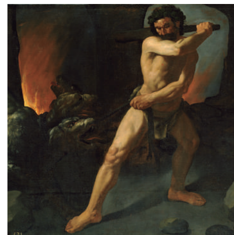
Francisco de Zurbarán Herkules eta Zerbero (xehetasuna), 1634.