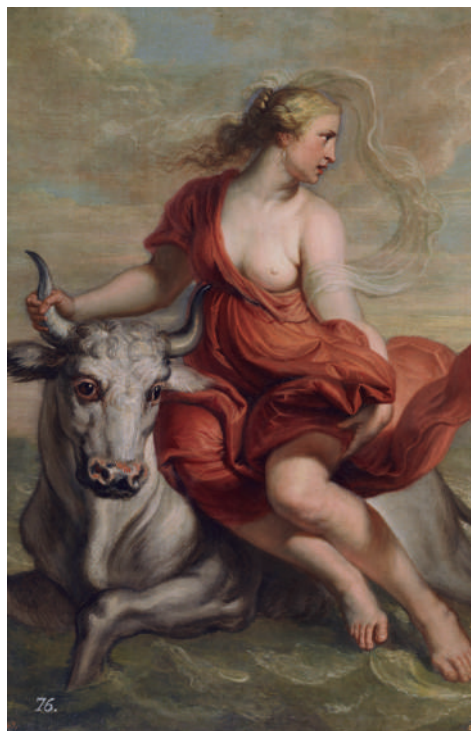
Erasmus Quellinus Europaren bahiketa (xehetasuna), 1636-38.

Historian zehar, etengabeko inspirazio-iturria izan da mitologia klasikoa artista ugariarentzat, eta kontakizun zoragarri horiek zeramika-piezetan, marmolezko blokeetan, dominetan, tauletan eta mihisetan bilduta geratu ziren, erakusketa honetan ikus daitekeen bezalaxe. Pradoko Museoko obrek —K. a. I. mendearen erdialdetik XVIII. mendearen amaie-