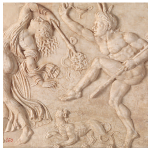
Lantegi neotikoa Estasi dionisiakoa (xehetasuna), 50-40 K. a.

sia— helburu jakin batzuk lortzeko, batez ere amodio-konkistak, gai hori Jainkoen eta gizakien itxuraldatzeak eskainitako esparruan garatzen delarik. Zazpigarren esparruan Herioak dira ardatz, gaitasun bereziak dituzten gizaki hilkorak, jainko baten seme edo alaba izatearen ondoriozko gaitasunak, hain zuzen ere, eta erakusketaren azken atala, Troiako gerra , borrokaldi ospetsu horri dago eskainia, zeinean jainkoak eta gizakiak elkarrekin borrokatu baitziren. Su suntsitzaileak hiria errausten du, eta garbitze-lana ere egiten du —Eneasen ihesaldiari lotuta, haren ondorengoek hiri berri bat sortuko baitute handik gutxira, Erroma—, erakusketari amaiera emanez.