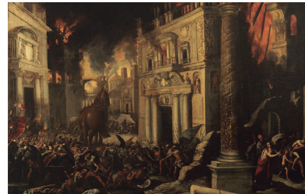
Francisco Collantes. Troiako sutea (xehetasuna), XVIII. mendea.