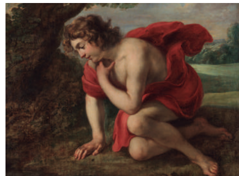
Jan Cossiers Nartziso (xehetasuna), 1636-38.