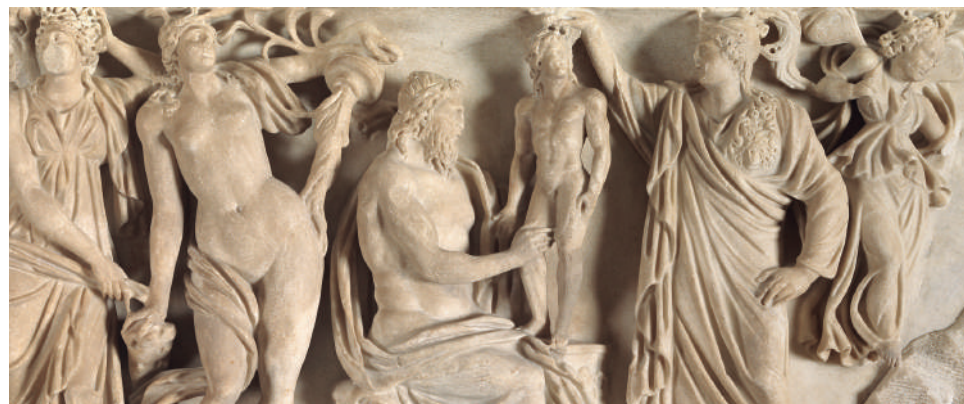
Erromatar lantegia. Prometeo eta Atenea lehen gizakia sortzen (xehetasuna), Ca. 185.

Olinpoko jainkoak eta Espiritu libreak atalean jainko greko-erromatar nagusiak agertzen dira, haien istorioak erakusketako beste esparru batzuetan garatuko direlarik, eta beren abenturetan lagun izango dituzten bigarren mailako beste zenbait pertsonaia-rekin batera: ninfa, musak, satiroak, menadeak... Puntu honetan azpimarratzekoa da ikus-entzu-