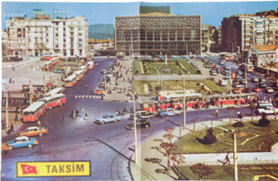
Frederic Lezmi - #Taksim Calling - Istanbul, 2013